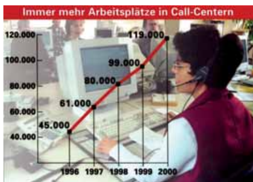
Alemania registra un aumento del número de puestos de trabajo en centros de llamadas

En el estudio, los expertos hicieron especial hincapié en los riesgos multifactoriales. La bibliografía se centra en los centros de llamadas que últimamente se han multiplicado y que ofrecen nuevos tipos de trabajo con exposición múltiple: mucho tiempo sentado, ruido de fondo, auriculares inadecuados, mal diseño ergonómico, bajo control de las tareas, presión debida a los plazos, alta exigencia mental y emocional. Las personas que trabajan en los centros de llamadas presentan trastornos musculoesqueléticos, venas varicosas, enfermedades de la nariz y la garganta, trastornos de la voz, estrés y síndrome de estar quemado.